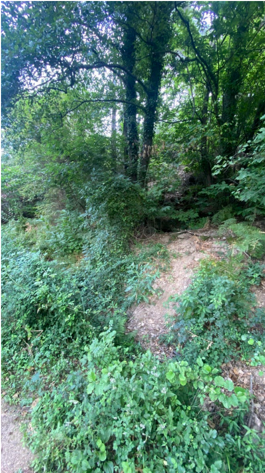
L'accès à la source vue du chemin